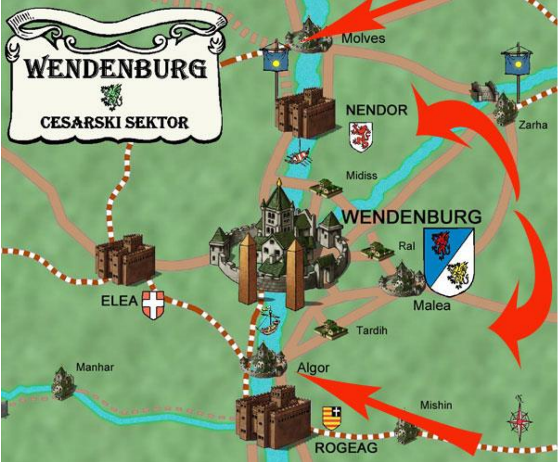
Kleščni manever carske armade, ki se je končal s Padcem.