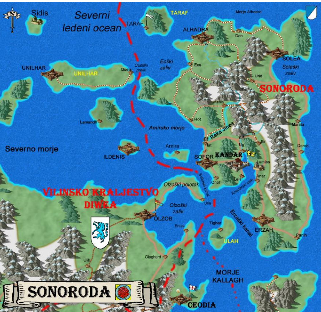
Mealkud Sonoroda okoli leta 905 že