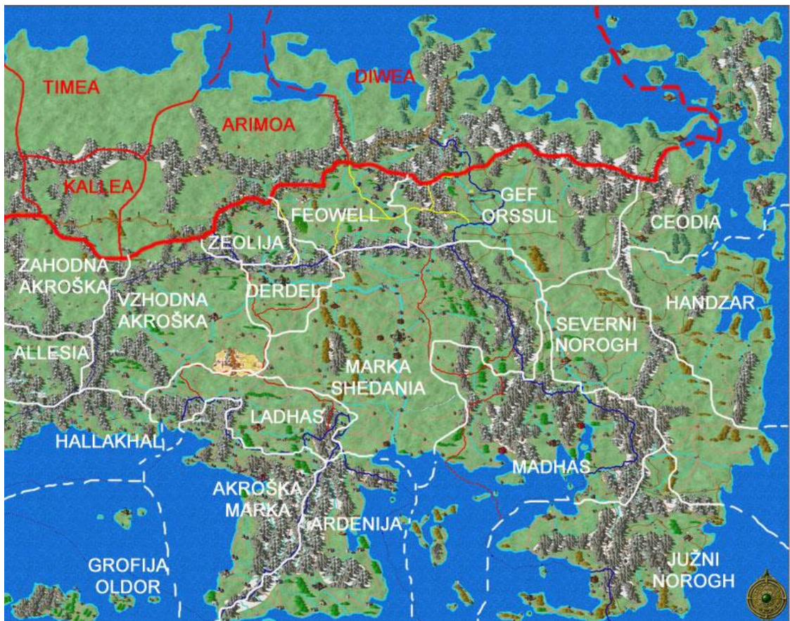
Svetovno cesarstvo okoli leta 850 z.e